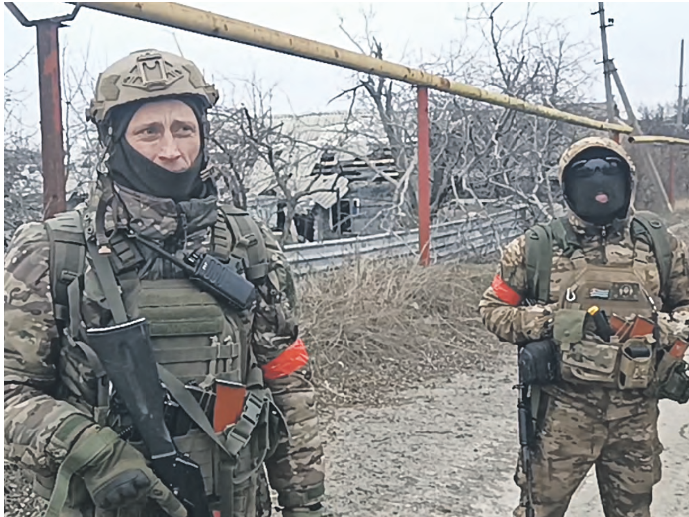
19 февраля. Авдеевка. Боец отряда зачистки с позывным «Крест» (слева) с напарником работает вместе с частями инженерных войск. Также наши военнослужащие стараются оказать помощь местным мирным жителям.

Инструктаж строгий: — Идти только по тропинкам, ни шагу направо или налево, могут быть и «лепестки», и противотанковые мины, и бог знает что еще. Поедем быстро — сегодня пасмурно, но «птички» все равно нет-нет да и прилетают. Следим за небом — на всякий случай, — инструктирует командир взвода с позывным «Усман». В качестве доказательства нам демонстрируют извлеченную недавно на пути нашего следования ТМ-57 — противотанковую мину еще советского производства. — В первую очередь наша задача здесь — инженерное разграждение дорог для прохода техники и личного состава. Дальше мы будем расширять зону безопасности, — говорит «Усман». Чтобы побеседовать, прядемся за полуразрушенным кирпичным частным домом. Впрочем, целых строений тут почти не осталось. — Находим много «сюрпризов», минирование плотное. Противник использует и старые советские мины, и мины стран НАТО. Если «птичка» в небе нет, стараемся сдирать мины кошками, а потом в безопасных местах с ними работать. Саперы вообще не любят ясного неба. Вот сегодня непогода и много работы смогли сделать. Чуть дальше — изрядно покоренный обстрелами мост через небольшой ручей. И тут саперам тоже пришлось изрядно потрудиться — его окрестности противник превратил в сплошное минное поле. А инженерное сооружение было пригнотвлено к подрыву. — При проведении инженерной разведки маршрута продвижения наших войск было обнаружено противотанковое минное поле, а также радиоуправляемый фугас, заложены под мост. Мы вовремя по-