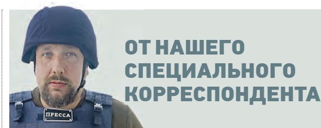
ОТ НАШЕГО СПЕЦИАЛЬНОГО КОРРЕСПОНДЕНТА

Артисты балета из разных стран прошли отбор на участие в международном конкурсе. Репортаж с репетиции → стр. 7