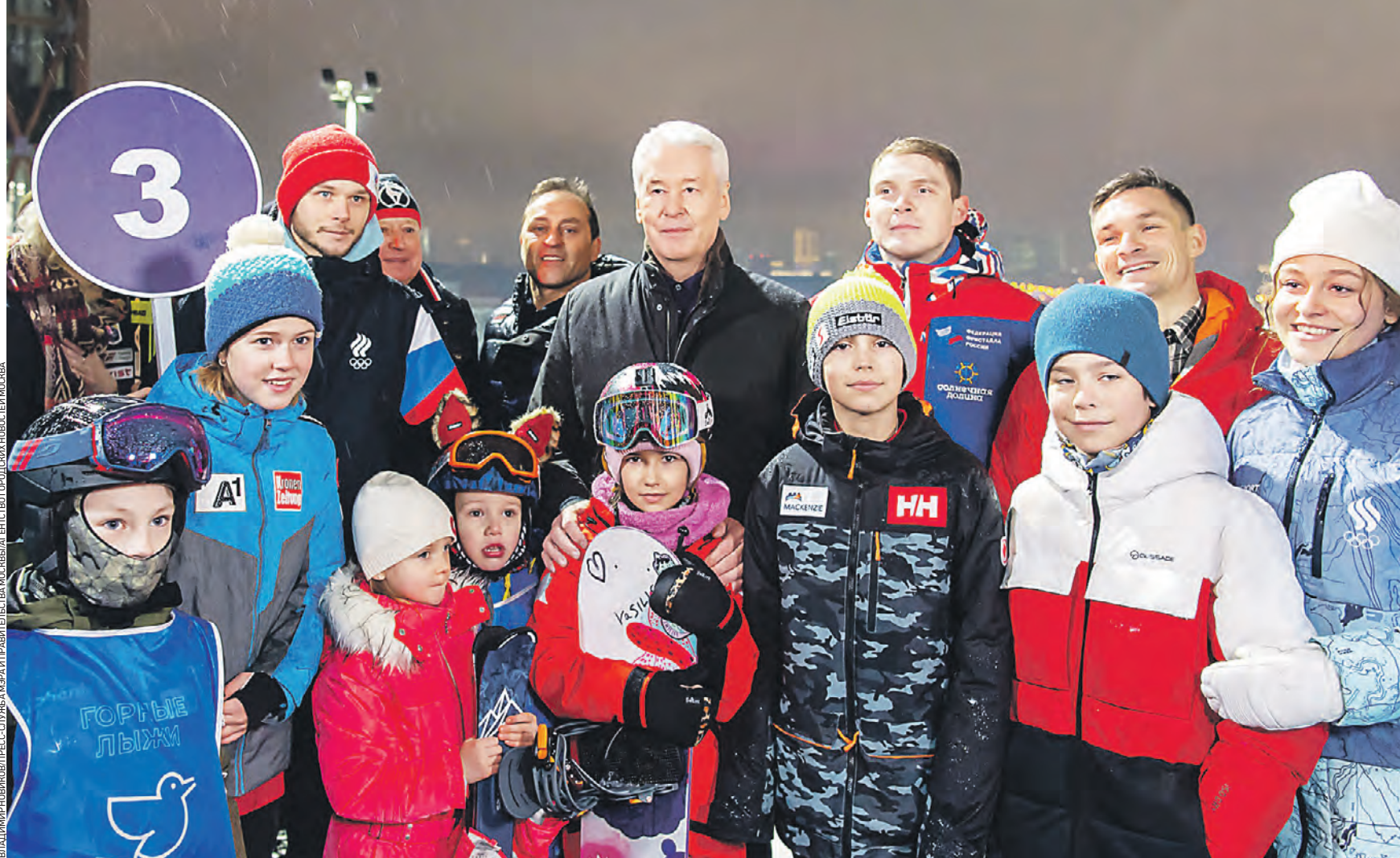
23 декабря 2022 года. Мэр Москвы Сергей Собянин (в центре) на открытии эскалаторной галереи и горнолыжного комплекса на Воробьевых горах. Позаниматься зимними видами спорта москвичи могут также на площадках, которые работают на базе образовательных организаций

Позаниматься зимними видами спорта в свободное от занятий время можно и в Центре творчества «Пресня». Учреждение дополнительного образования приглашает на каток всех желающих.