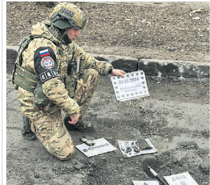
20 февраля. Сотрудник СЦКК в Донецке на месте обстрела фиксирует очередное преступление украинских националистов.